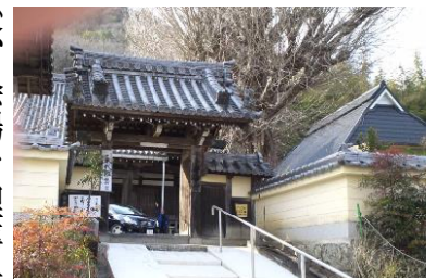
役員会場の専念寺

跡公園など赤穂藩五万石の、いや製塩を背景として石高以上の風格と風情を十分に堪能させて頂きました。 市内見聞の後は理事長様ご最前のお店で瀬戸内の幸盛り沢山の昼食。そ