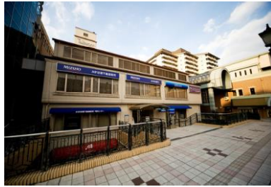
芦屋駅前・ホテル竹園